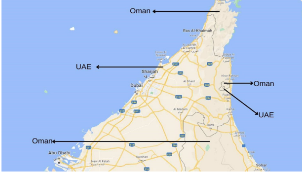
Şekil 2: BAE ve Umman anklavları ve eksklavları

Anklav ise başka bir devletin siyasi biriminin kendi devletinin sınırları içinde bulunması durumudur. Şekil 1'de görülebileceği üzere C bölgesi B ülkesinin anklavıyken A ülkesinin eksklavı durumundadır.[1]