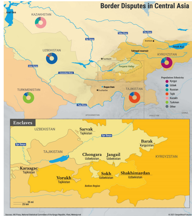
Şekil 5: Orta Asya'da bulunan anklavlar7