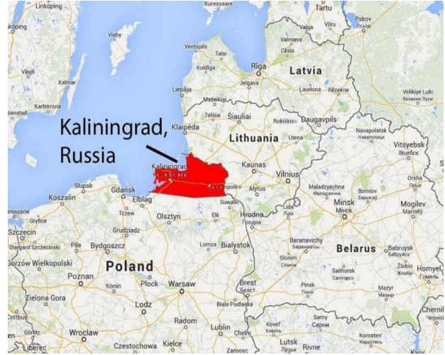
Şekil 3: Kaliningrad'ın haritadaki yeri

görülmektedir. Bu durum devletlerin bu topraklar üzerindeki egemenliklerini kaybetmemek için çatışmayı bile göze almalarına sebep olmaktadır. Örnek olarak denizlerdeki ticaret yollarını kesen altı farklı geçiş bulunmaktadır.[2] Bunlardan üçündeki (Musandam, Panama ve Gwadar) yerleşim bölgeleri jeostratejik olarak önemlidir. Ayrıca Avrupa'nın ortasında yer alan ve önemli bir askerî üs, jeostratejik avantaj ve enerji kaynağı olarak değerlendirilebileceğimiz Kaliningrad da bu güvenlik örneklerinden biridir.[3]