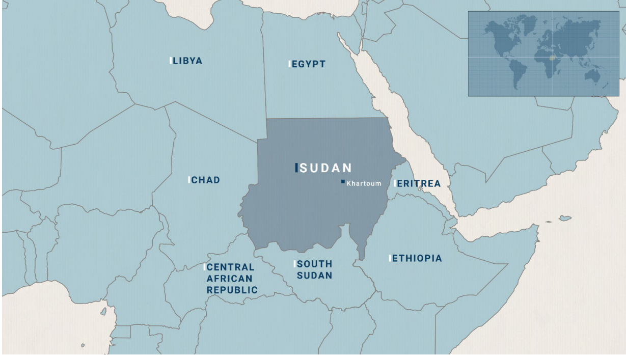
Sudan Haritası (Harita Tasarımı: Esra Tatlı)