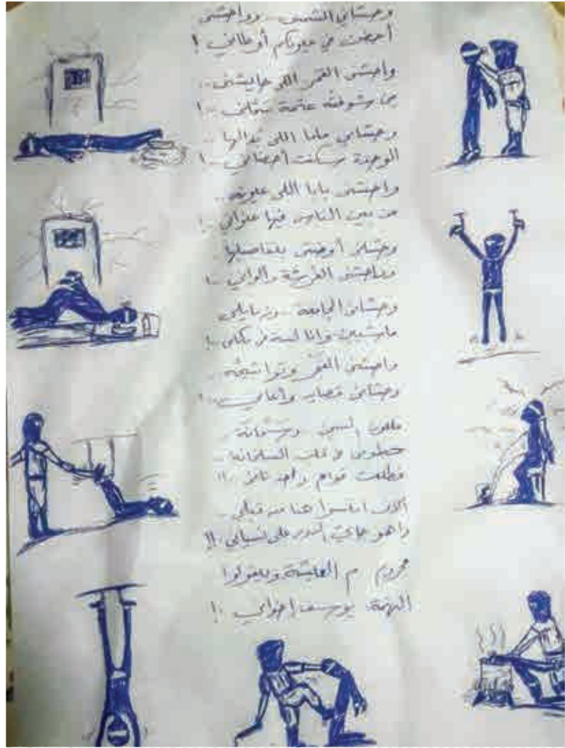
Askerî Darbeden Sonra Mahkûm Edilen Birinin Gördüğü İşkenceleri Çizdiği Resim

Bu kapsamda 2015 yılı Ocak ayında İhvan-ı Müslimin üyesi 901 kişinin ve harekete ait 1.096 derneğin