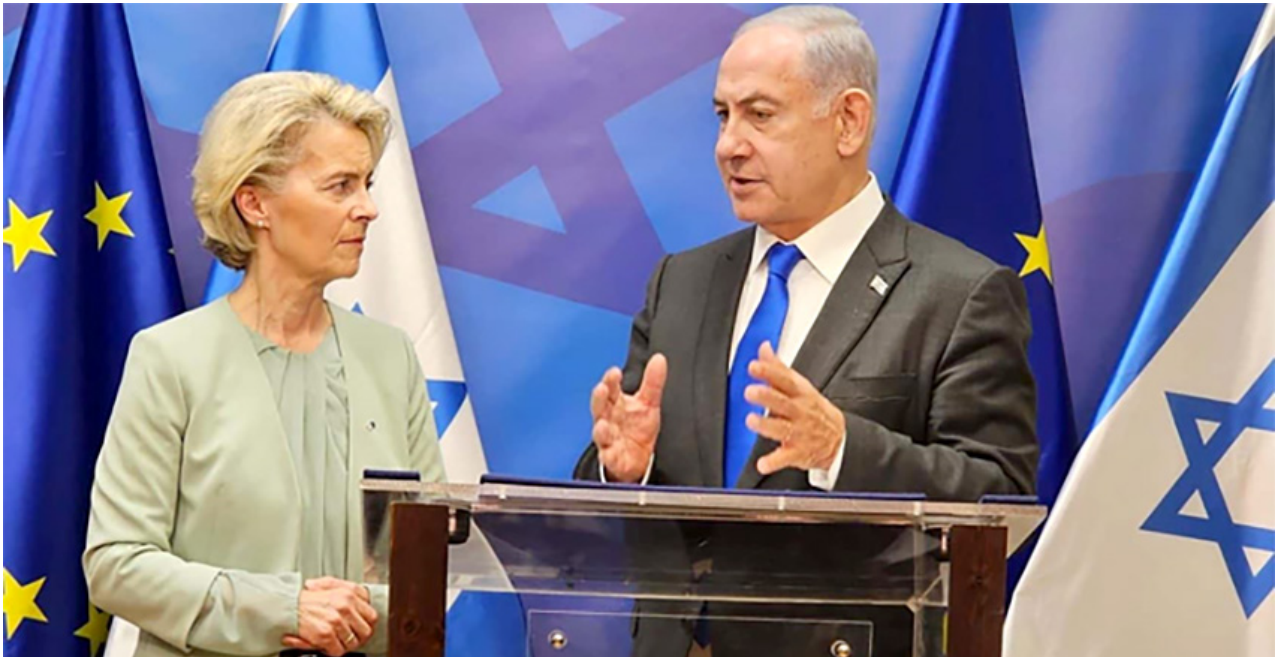
Görsel: "AB Komisyonu Başkanı Leyen, Tel Aviv'de Binyamin Netanyahu ile görüştü." 13 Ekim 2023.

İsrail'in gerçekleştirdiği orantısız misillemeler sonrasında 13 Ekim tarihinde Avrupa Komisyonu Başkanı Ursula von der Leyen Gazze'de sivillere yönelik saldırılar sürerken İsrail'i ziyaret etti. Ziyaretinde İsrail Başbakanı Binyamin Netanyahu'nun yanında durduğunu vurgulayan Leyen, "İsrail'in kendini savunma hakkına sahip olduğunu, onun bir demokrasi ülkesi olduğunu ve saldırılara